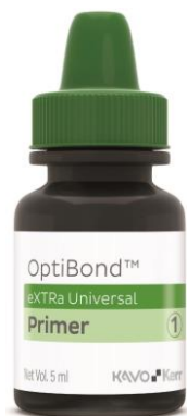
オプチボンド eXTRa プライマー