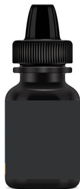
親水性寄りの 1液性製品