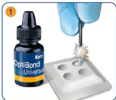
マイクロブラシに採取