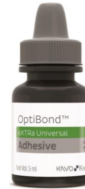
オプチボンド eXTRa アドヒーシブ