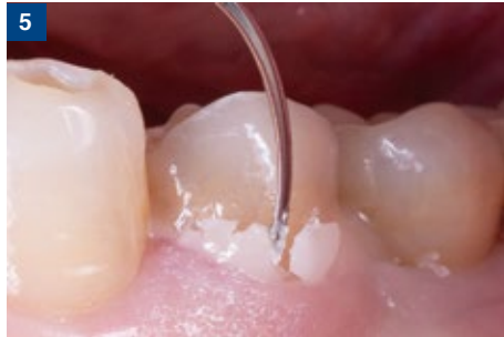
5 余剰セメントは簡単に除去できる。