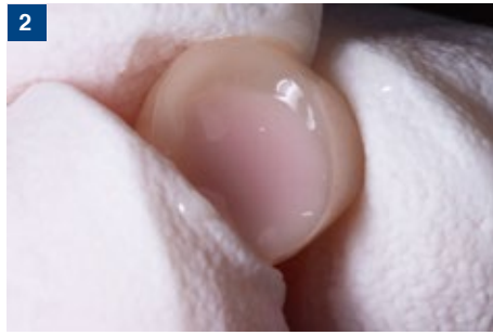
2 CAD/CAM冠内面はサンドブラスト後、清掃し、オプチボンド ユニバーサルを塗布、エアブロー、光照射後、マックスセム エリート クロマを填塞する。