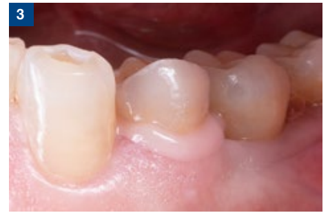
3 全周から余剰セメントが溢れることを確認、余剰セメントはピンク色を示す。