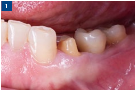
1 支台歯にはオプチボンド ユニバーサルを塗布し、エアブロー、光照射を行う。