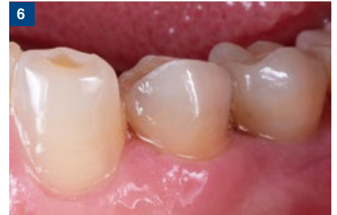
6 余剰セメントの除去完了。この後、再度光照射を行う。