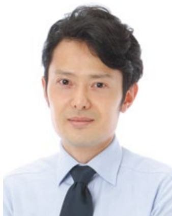
岩田歯科医院 院長 (兵庫県)